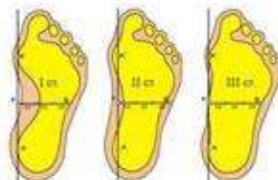
Степени продольного плоскостопия